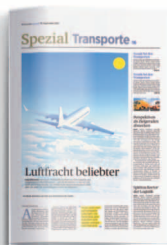
Transporte 8. Oktober 2021