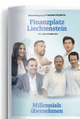
Finanzplatz 24. September 2021