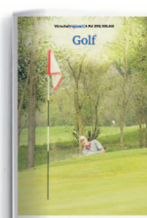
Golf 7. Mai 2021