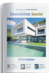
Immobilien 29. Oktober 2021