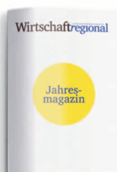
Jahresmagazin 7. Januar 2022