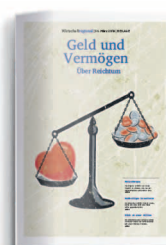
Geld und Vermögen 18. März 2021