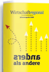
Jahresmagazin 8. Januar 2021