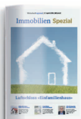
Immobilien 30. April 2021