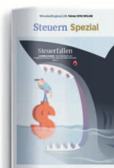
Steuern 12. Februar 2021