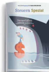
Steuern 14. Februar 2020