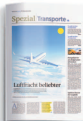
Transporte 2. Oktober 2020