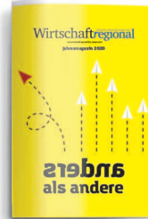
Jahresmagazin 4. Januar 2020