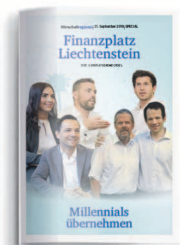
Finanzplatz 18. September 2020