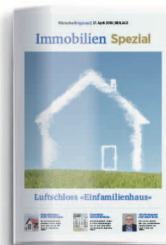
Immobilien 3. April 2020