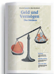
Geld und Vermögen 27. März 2020