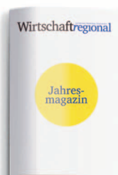
Jahresmagazin 8. Januar 2021