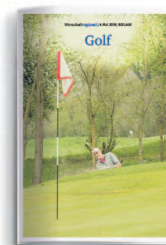
Golf 8. Mai 2020