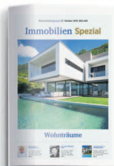
Immobilien 23. Oktober 2020