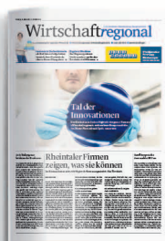
Precision Valley Rheintal 16. Juni – 7. Juli 2023