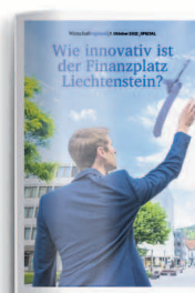
Finanzplatz 27. Oktober 2023