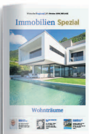
Immobilien 6. Oktober 2023