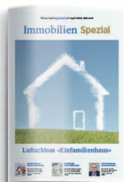
Immobilien 6. April 2023