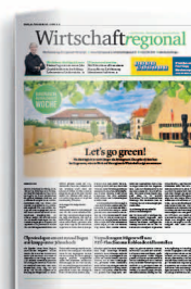
Nachhaltigkeit 22. September 2023