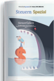
Steuern 10. Februar 2023