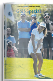
Golf 12. Mai 2023