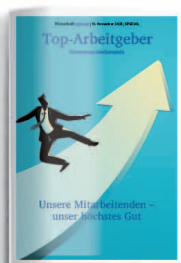
Top Arbeitgeber 17. November 2023