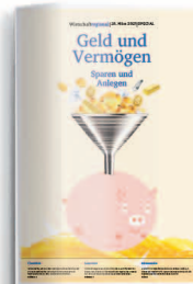
Geld und Vermögen 10. März 2023