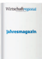
Jahresmagazin 5. Januar 2024