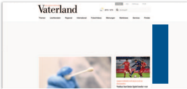
Skyscraper (160 x 600 Pixel)