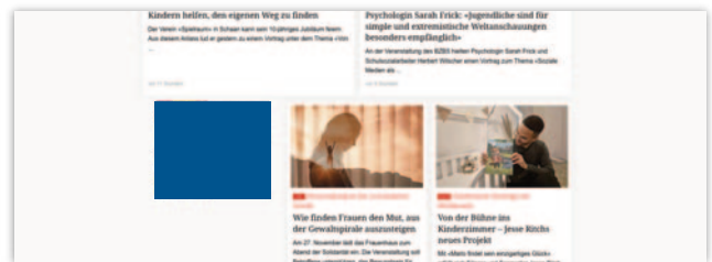
Rectangle (300 x 250 Pixel)