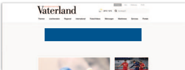
Maxiboard (Desktop 994 x 118 Pixel, Mobile 320 x 160 Pixel)