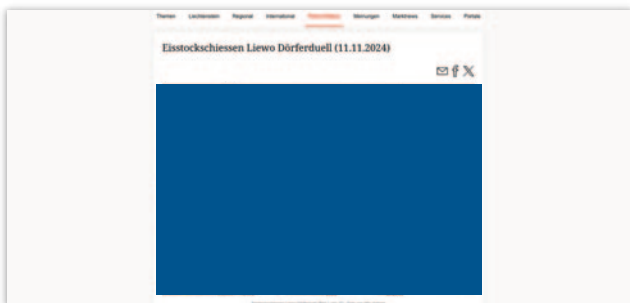
Bildergalerie (Desktop 1086 x 630 Pixel, Mobile 320 x 180 Pixel)