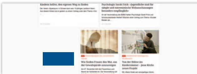
Button (300 x 120 Pixel)